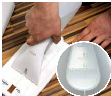
Mit der speziellen Dosierflasche lässt sich exakt die richtige Menge Feuchtigkeit auf das Tuch bringen.

Die Reinigungsleistung des Vorwerk Kobold Hartbodenreinigers SP530 ist im Allgemeinen als sehr ►