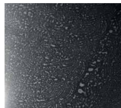
Zu feuchte Reinigungstücher hinterlassen Wasserflecken, welche jedoch z.B. durch eine trockene Nachbearbeitung wieder entfernt werden können.