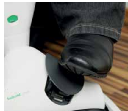
Um die Wischbewegung zu starten, muss die Luftklappe geschlossen werden.