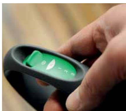
Die Saugkraft lässt sich beim Kobold VK150 bequem am Handgriff regulieren.

Für andere Bodenbeläge wie Fliesen, Linoleum oder PVC empfehlen sich die Universal-Soft-Tücher oder auch die herkömmlichen Universal-Tücher, welche 80 bzw. 100 ml Flüssigkeit erfordern und ebenfalls nach jeder Benutzung durch ein frisches ersetzt und entsprechend benetzt werden sollten. Die Tücher kommen nach Gebrauch einfach in die Waschmaschine und auch neue, unbenutzte Tücher sollten vor der ersten Verwendung gewaschen werden, damit sie