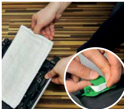
Nach dem Anfeuchten wird das Tuch auf den Tuchträger gesetzt und unter dem Gerät befestigt.