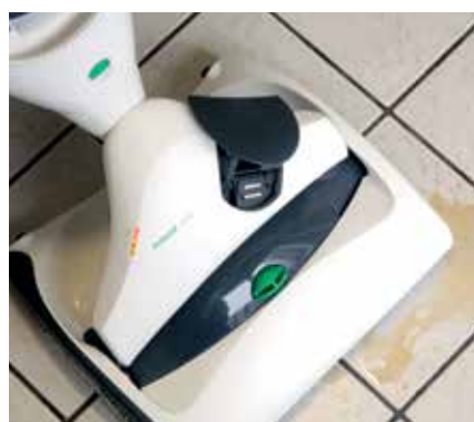
Zur Aufnahme von Flüssigkeiten wie z.B. verschüttetem Kaffee ist das Gerät nicht geeignet und schaltet zum Schutz vor Beschädigungen automatisch ab.

den Schmutz vollständig binden können. Auch die Saugfunktion erzielte gute Resultate, da jeglicher Schmutz vor dem Wischen aufgenommen wurde. Grobe und scharfkantige Partikel (z.B. Streugranulat, Scherben) sollten jedoch vor Benutzung des Geräts entfernt werden, um Schäden am Fußboden zu vermeiden. Zur Aufnahme von Flüssigkeiten ist das Gerät nicht geeignet.